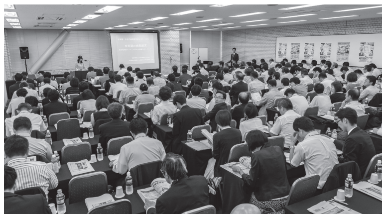
道内外から160人を超える医療経営士や病院関係者が参加した

属病院、東京女子医科大学病院の医療事故をきっかけに見直された特定機能病院の要件等について触れ、「高品質で安全な医療を達成するには、潜在的なリスクを前提とした、組織の継続的なチェックと病院管理者が主体的・継続的にチェックする体制が大切。あわせて、診療・教育・研究における財務基盤強化を図っていく必要がある」と管理体制のあり方を説いた。