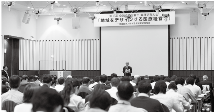
大盛況となった前回の京都大会。今年もより一層の盛り上がり期待される

お問い合わせ先 一般社団法人 日本医療経営実践協会 事務局 TEL.03-5296-1933 FAX.03-5296-1934 http://www.JMMPA.jp/