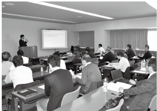
四国初、高松市で開催された勉強会

医療経営実践協会関西支部では3月1日、香川県高松市のアルファあなびきホールで、四国初となる「医療経営士勉強会in高松」を開催しました。