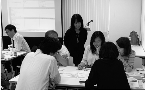
グループワークでは、所属先の新規事業案を検討した

の理念を実現するためのビジョンや戦略、戦術、計画が自分たちのあるべき姿や目指す方向性にきちんと合っているかどうかを検討し、その遂行において最適な経営資源を配分していくこと」と前置きしたうえで、課題を抽出し、戦略目標を導き出すためのSWOT分析、PEST分析、クロスSWOT分析の手法を解説した。その後、参加者はグループに分かれ、石井氏が実際に経営に携わった病院の事例をもとに戦略目標のアイデアを出し合った。