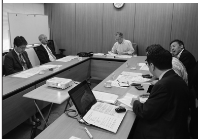
選考委員会では、委員6名による活発な意見交換の下、厳正な審査が行われた。

重視している点特徴だ。医療経営士以外にも広く門戸を開き、学者や専門研究職による理論重視の研究ではなく、医療経営士ならではの視点に基づく現場での課題発見と解決に向けた、より実践的な研究活動および地域医療や医療政策への積極的な関わりを推進し、研究内容を医療界・地域社会に還元するのが目的だ。