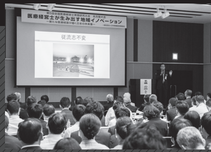
大盛況となった名古屋大会。熱い2日間が今年も幕を上げる