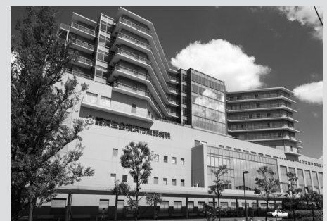
横浜市東部病院(病床数560、職員数1,328人)は、救命救急センター・集中治療センターなどを有する地域の中核病院