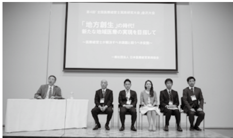
前回大会で好評だった各セッションごとのディスカッションは今大会でも実施

お問い合わせ先 一般社団法人 日本医療経営実践協会 事務局 TEL.03-5296-1933 FAX.03-5296-1934 http://www.JMMPA.jp/