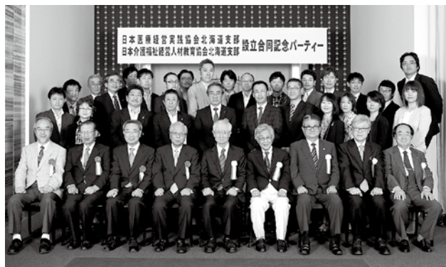
両協会の共催による設立合同記念パーティーには、協会本部の役員をはじめ、約40人の医療経営士・介護福祉経営士が参加した

お問い合わせ先 一般社団法人 日本医療経営実践協会 事務局 TEL.03-5296-1933 FAX.03-5296-1934 http://www.JMMPA.jp/