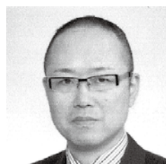
社会医療法人新潟勤労者医療協会 常務理事・経理部長