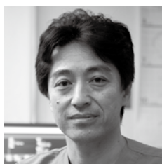
社会医療法人敬和会大分岡病院 副院長

学習する目的は、自分自身と組織の成長、そし て飛躍です。私たちの変化が組織の変化、さら には日本の医療の変化へとつながっていくことを期 待しています。