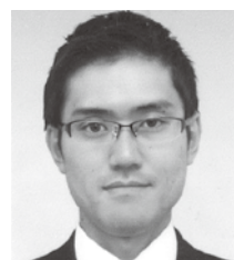
パナソニック健康保険組合松下記 念病院 事務部 医事課(兼)診療 情報管理室 課長代理

「医療経営士1級」は、2級よりさらに実践的な知識、 いわゆる実学が必要です。日頃から病院経営的 な視点に立って業務に取り組むことが、何よりの受 験対策になるのではないのでしょうか。