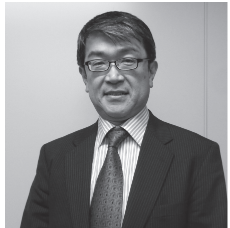
株式会社日医リース 審査部審査役 医療経営士2級

11月16、17日に福岡で開催される第2回「全国医療経営士実践研究大会」には、私を含め当社のスタッフ11人が参加する予定です。基調講演の「医療機関におけるアメーバ経営」(森田直行氏/KCCSマネジメントコンサルティング株式会社代表取締役会長)をはじめ興味深い講演が多く、医療経