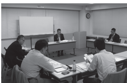
4月18日に行われた第1回「フェイズ・スリー塾」