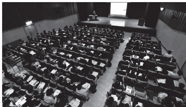
会場を埋め尽くした医療経営士の熱気で溢れた前回大会

お問い合わせ先 一般社団法人 日本医療経営実践協会 事務局 TEL.03-5296-1933 FAX.03-5296-1934 http://www.JMMPA.jp/